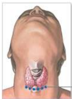
محل برش جراحی