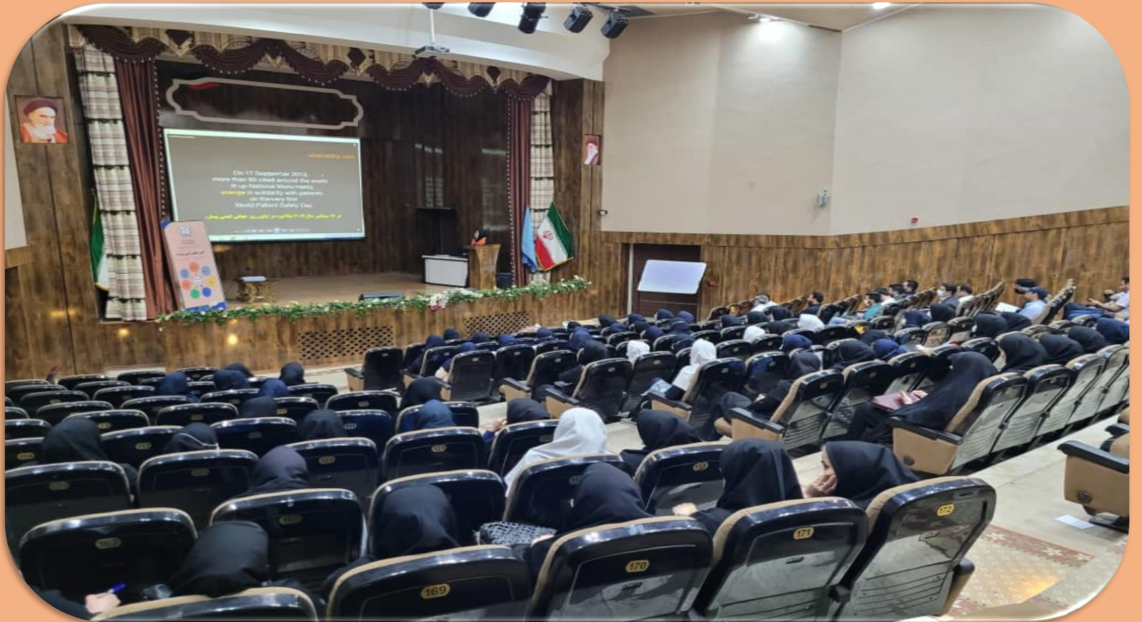
بیمارستان امام خمینی (ره) اردبیل. ایمنی بیمار