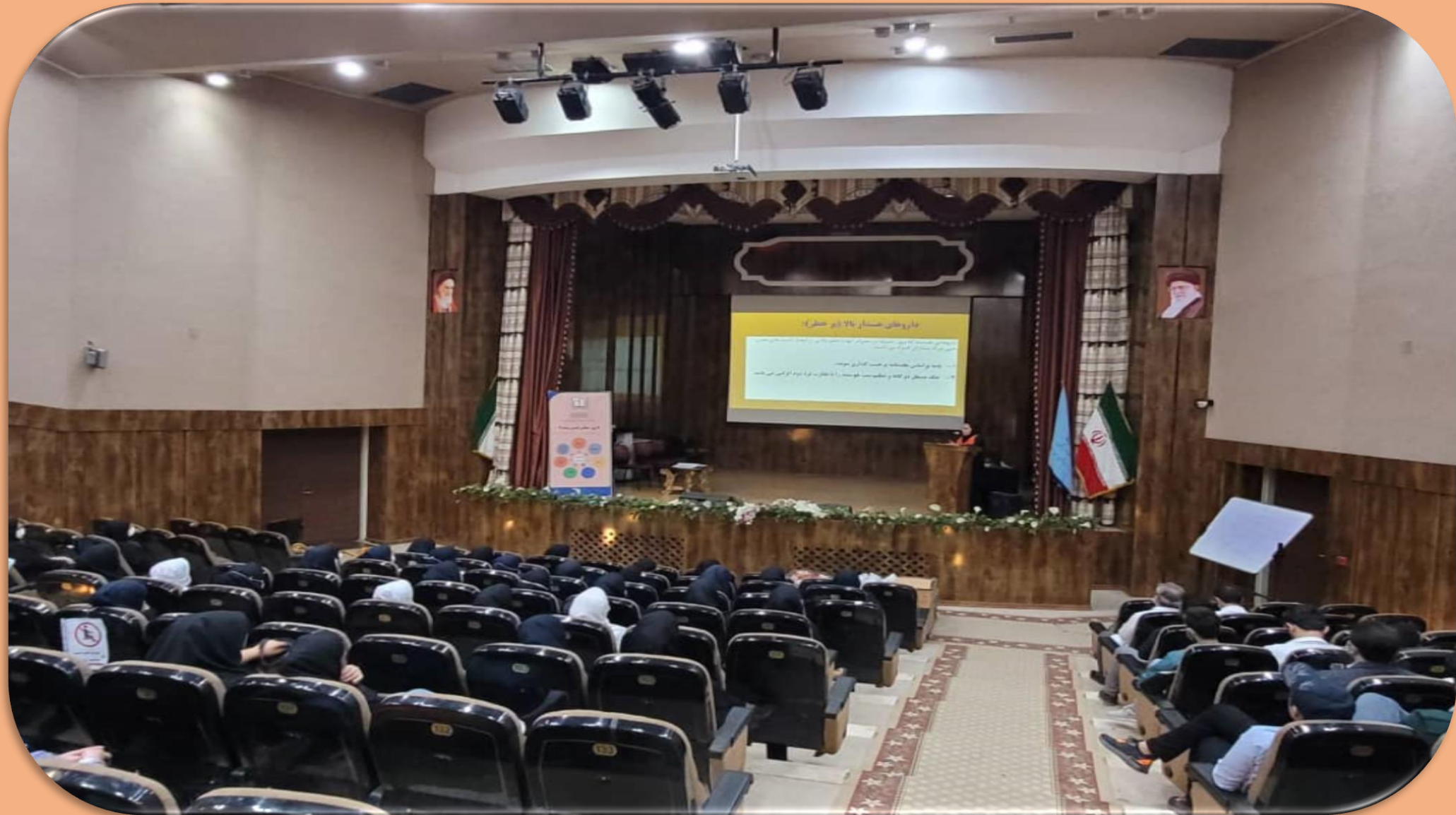
بیمارستان امام خمینی (ره) اردبیل. ایمنی بیمار