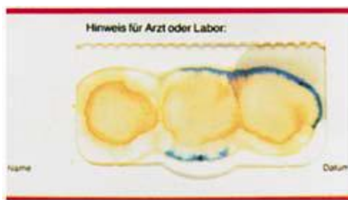
نتیجه تست مثبت