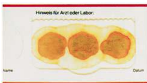
نتیجه تست منفی

عدم تغییر به رنگ آبی می بایست به عنوان تست منفی برای خون مخفی در مدفوع تلقی شود.